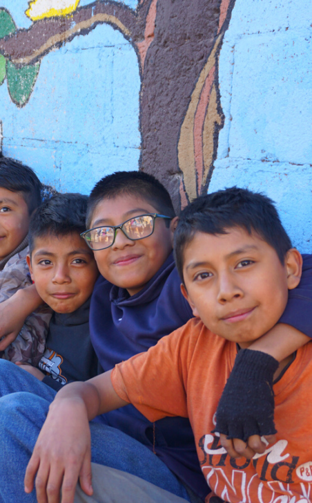
Viaje de inmersión en Guatemala.

“ No son ustedes los que me han elegido, soy yo quien los ha elegido. ”