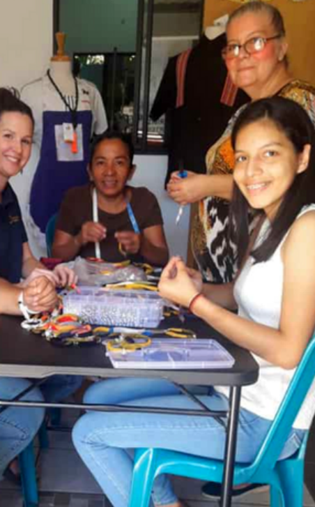
Una joven se une a los miembros de la cooperativa en un taller de fabricación de pulseras.

“ Así como tú me enviaste, así los envío yo también al mundo. ”