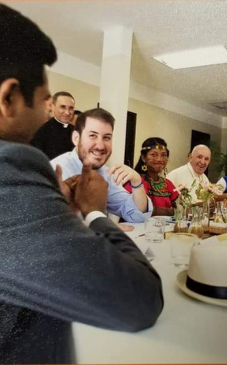
Papa Francisco comiendo en Panamá con 10 jóvenes adultos de todo el mundo.